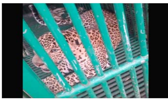
નિહાલી ગામની ચારેતરફ ખેતરાળ વિસ્તાર, પુષ્કળ પાણીની સુવિધા અને

ભાગરૂપે પટેલ ફળિયાના મુખ્ય માર્ગ પર પાંજરું મૂકવામાં આવ્યું હતું. સવારે દીપડાની ગર્જના સંભળાતા મામલો સામે આવ્યો હતો.વન વિભાગની ટીમને તુરંત જાણ કરવામાં આવતા કાફલો ઘટનાસ્થળે દોડી આવ્યો હતો અને દીપડાનો કબજો મેળવી તેને સુરક્ષિત સ્થળે ખસેડવાની કાર્યવાહી હાથ ધરી હતી.