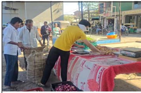
કીમ ગામના મુખ્ય બજાર અને બ્રિજ નીચેના વિસ્તારમાં સાંજ પડતાં જ ભારે ટ્રાફિક જામના દૃશ્યો સર્જતા હતા.

ઓલપાડ- સુરત જિલ્લાના ઓલપાડ તાલુકાના કીમ ગામમાં ટ્રાફિકની વર્ષો જૂની સમસ્યાના નિરાકરણ માટે ઓલપાડ માર્ગ અને મકાન વિભાગ દ્વારા મહત્વની કાર્યવાહી હાથ ધરવામાં આવી હતી. ગામના મુખ્ય માર્ગ અને રેલવે ઓવરબ્રિજ નીચેના વિસ્તારમાં પડકાયેલા લારી-ગલ્લા અને દબાણોને શાંતિપૂર્ણ માહોલમાં દૂર કરવામાં આવ્યા હતા.