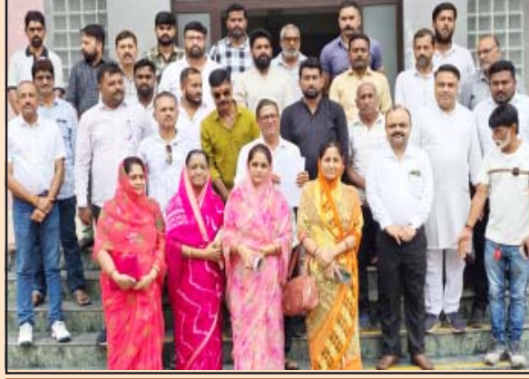
ભરૂચ- ભરૂચ કલેક્ટરને આવેદનપત્ર આપી નિષ્પક્ષ તપાસ કરવામાં આવે તેવી માગ કરી