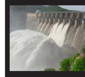
ઉપરવાસમાંથી પાણીની સતત આવકને કારણે ઉકાઈ ડેમ ૮૦ ટકા જેટલો ભરાઈ ગયો

ઉકાઈ ડેમના ઉપરવાસમાં આવેલાં પ્રકાશા બેરેજ માંથી ૧.૨૨ લાખ ક્યુસેક પાણી છોડાયું હતું જ્યારે ઉચ્છલ, બિઝર અને કુકરમુડામાં પણ ભારે વરસાદ નોંધાતા આ પાણીની ડેમમાં આવક થઈ હતી. સવારે દસ થી સાંજે છ સુધી સતત ત્રણ લાખ ક્યુસેક કરતાં વધુ પાણીની આવક થઈ હતી જેની સામે જાવક ૧૯૫૦૦૦ ક્યુસેક રાખવામાં આવતાં ડેમની સપાટી પહેલી સાપ્ટેમ્બરના રુલ લેવલ ૩૩૫ ફૂટ ને વટાવી દીધી હતી. સાંજે છ કલાકે ડેમમાં પાણીની આવક ૩૨૨૬૫૮ ક્યુસેક જ્યારે જાવક ડેમના પંદર દરવાજા આઠ ફૂટ ખોલી ૧૯૫૭૨૦ ક્યુસેક રાખવામાં