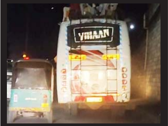
રક્ષાબંધનના પર્વ પર મુસાફરો જીવ જોખમમાં મૂકી મુસાફરી કરતા હોય તેવો વીડિયો હાલ સામે આવ્યો છે. સુરત જિલ્લાના કામરેજ ચારરસ્તા પાસે એક ખાનગી લકઝરી બસમાં બસ ચાલકે થોડા રૂપિયાની લાલચે મુસાફરોનો જીવ જોખમમાં મૂકી દીધો હતો. લકઝરી બસની ઉપર બેસાડી દીધા હતા.

બારડોલી- કામરેજ ચાર રસ્તા પાસે લકઝરી બસમાં મુસાફરો જીવના જોખમે લકઝરી બસ પર મુસાફરી કરતા હોવાનો વીડિયો સામે આવ્યો છે. લકઝરી બસની સીટો ફૂલ થઈ જતાં બસની ઉપર મુસાફરો બેસી ગયા હતા. જોખમી મુસાફરીમાં કોઈ મોટી દુર્ઘટના સર્જાય તો જવાબદાર કોણ તેવા સવાલો હાલ ઊભા થયા છે.